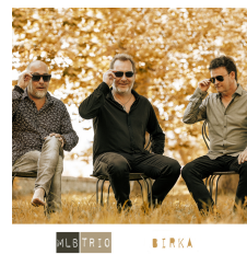
MLB TRIO BIRKA NOVEMBRE 2021