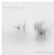
UNE LARME DE PLUIE SEPT 2022