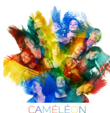
ENSEMBLE CAMÉLÉON MARS 2022