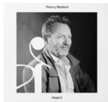
ASGARD SEPT 2023