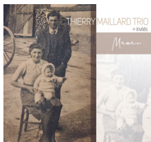
MAMAN JANV 2024