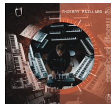
MOOG PROJECT AVRIL 2023